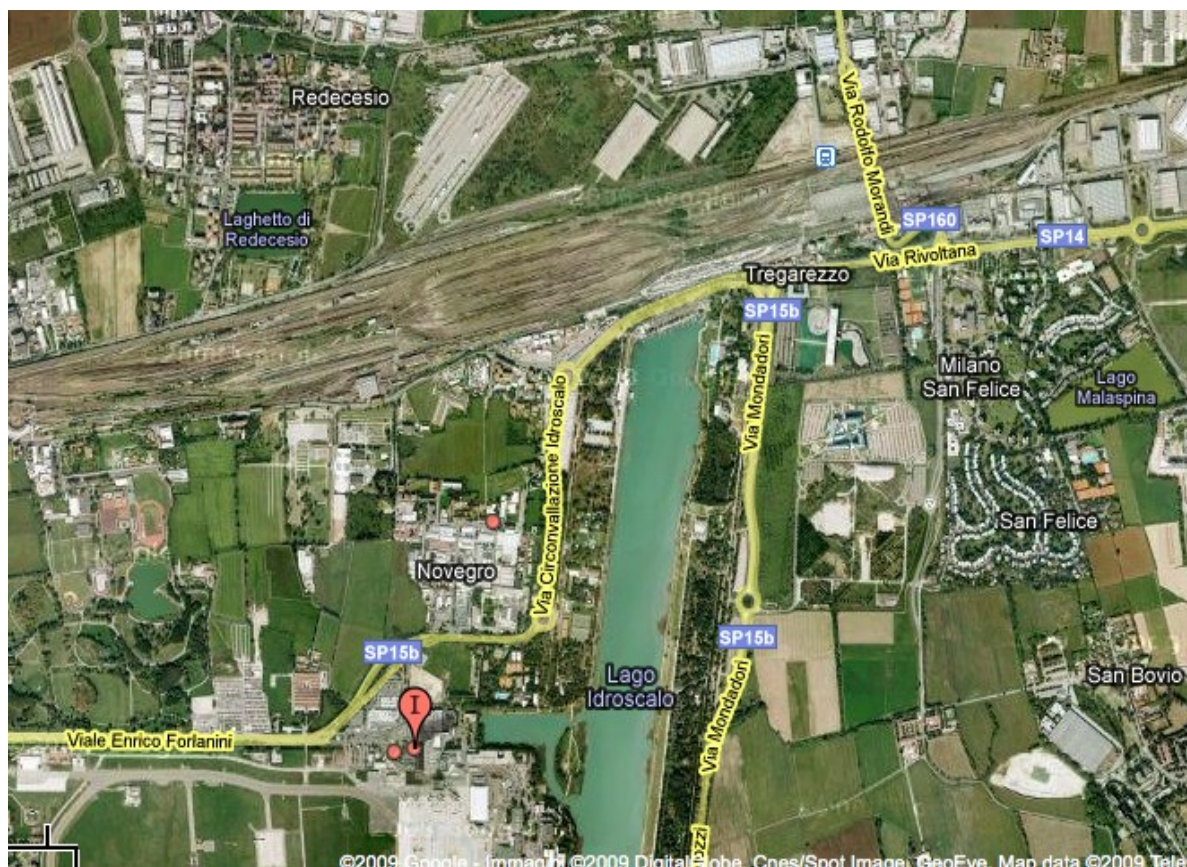
Figura 3: i due chilometri tra Linate e la stazione di Segrate.

Cosa costerebbe una simile robusta offerta di trasporto pubblico lungo lo stesso percorso del tunnel proposto dal “partito dell'automobile”?