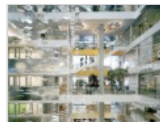
Il Genzyme Centre a Cambridge, 2004. Progetto: Stefan Behnisch