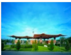
Tetto dell’Expo di Hannover, 2000. Progetto: Thomas Herzog

Ha inaugurato ieri sera alla Triennale di Milano la mostra “Green Life: costruire città sostenibili” , curata da Legambiente , dedicata agli architetti e alle città che “hanno saputo darsi una visione del futuro, hanno adottato strategie coraggiose, hanno messo in atto azioni concrete per un’architettura più sostenibile” . Obiettivo del progetto è dare evidenza a come urbano e sostenibile non siano oggi in contrapposizione ma che, anzi, proprio dalle città sostenibili del prossimo futuro possono giungere risposte e soluzioni concrete.