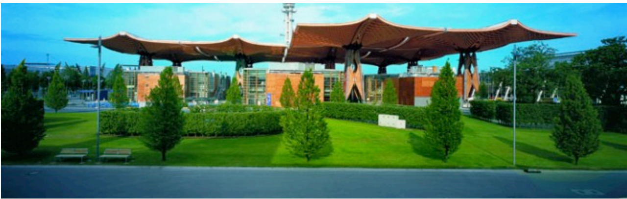
Tetto dell'Expo di Hannover, 2000. Progetto: Thomas Herzog

Ha inaugurato ieri sera alla Triennale di Milano la mostra “Green Life: costruire città sostenibili” , curata da Legambiente , dedicata agli architetti e alle città che “hanno saputo darsi una visione del futuro, hanno adottato strategie coraggiose, hanno messo in atto azioni concrete per un’architettura più sostenibile” . Obiettivo del progetto è dare evidenza a come urbano e sostenibile non siano oggi in contrapposizione ma che, anzi, proprio dalle città sostenibili del prossimo futuro possono giungere risposte e soluzioni concrete.