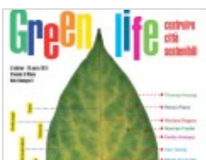
La locandina della mostra

Legambiente e la Triennale affrontano questo tema mettendo al centro i grandi architetti. Le città del futuro “potranno dare speranza a quella metà della popolazione mondiale che è diventata urbana, talvolta cingendo d’assedio i nuclei storici con nuovi agglomerati di fango e lamiera. È necessario passare dall’utopia alla realizzazione, per dimostrare che è possibile vivere diversamente negli spazi urbani; bisogna interpellare i saperi, della scienza e della cultura, perché nessuno è autosufficiente” .