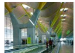
Il nuovo terminal dell’aeroporto Barajas di Madrid, 2006. Progetto: Richard Rogers Partnership