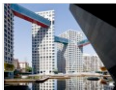
Linked Hybrid Beijing, Cina. Progetto: Steven Holl Architects