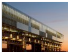
Kraanspoor, Amsterdam, 1997. Progetto: Ontwerpgroep Trude Hooykaas